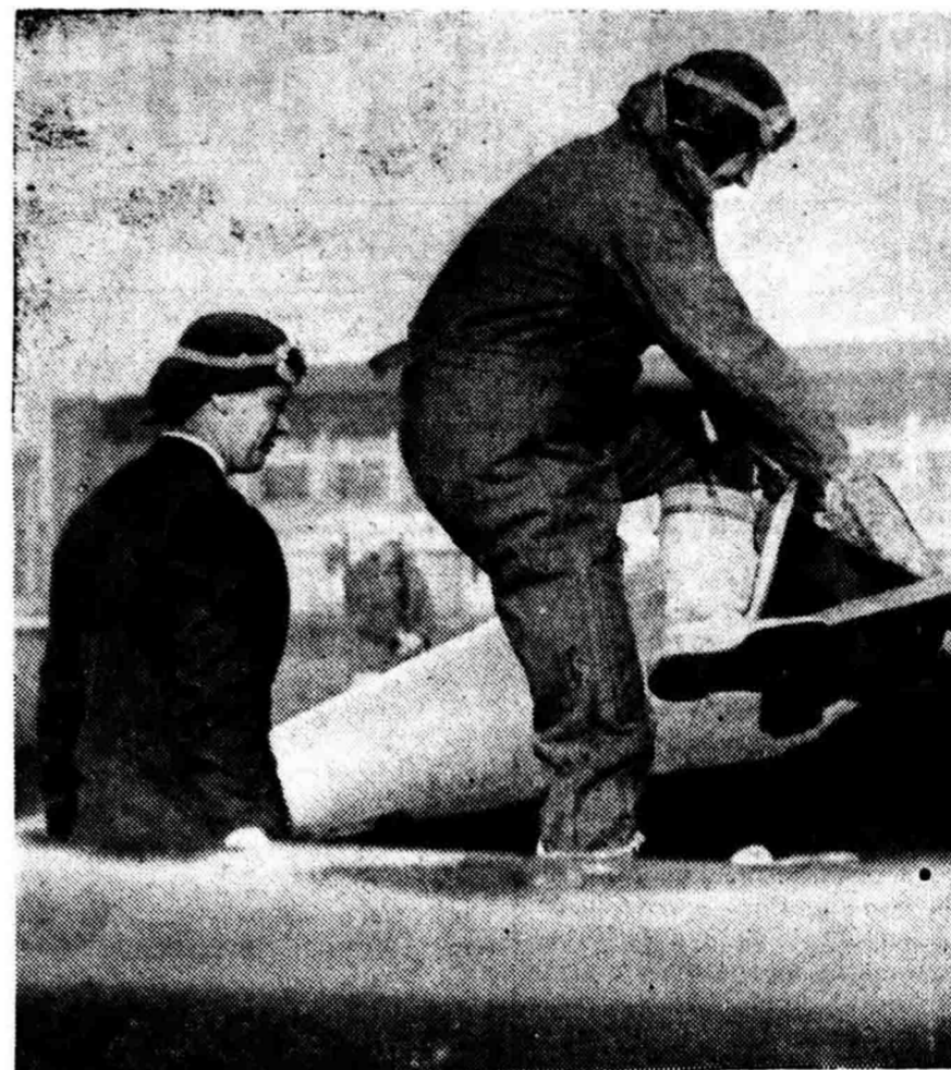
Kolonel Charles Lindbergh dengan mesin terbangnja.

Sesoedah orang 2 doedoek, laoe seorang datoek berdiri dari tempat doedoeknja dan dengan seorang perempoeran ia laoe melakoekan oepa-