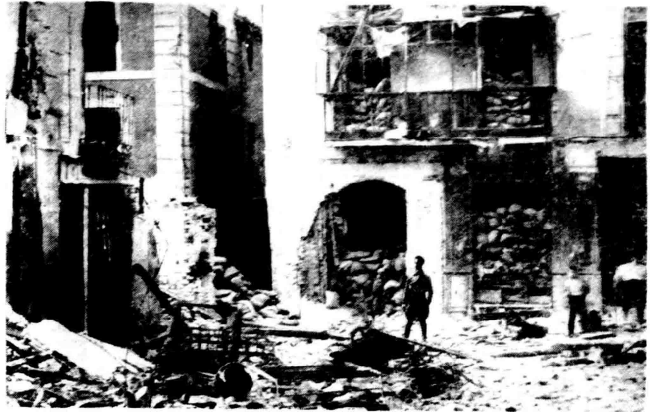
Soeatoe pemandangan dalam kota Madrid (Spanjol) sebagai jang sekarang banjak nampak disana. Sisa-sisanja gedoeng-gedoeng indah dan besar, kalau habis peperangan dalam mana tiap-tiap roemah telah digoekakan sebagai benteng (lii, tlah karoeng-karoeng pasir), jalah sebagai jang nampak digambar atas ini.

Motto jang kita pakai: Kembali ke desa! akan kita pakai teroes meneroes dalam membitjarakan berbagai? soal jang mengenai kepentingan rakjat. Seperti kita katakan tadi, segala soal? penting bermoeala dari desa, sekarang kewadiban segenap orang jang berperasaan menangoeng djawab oentoeq memalingkan moeka kedesa! (Pers-bureau „Arta“).